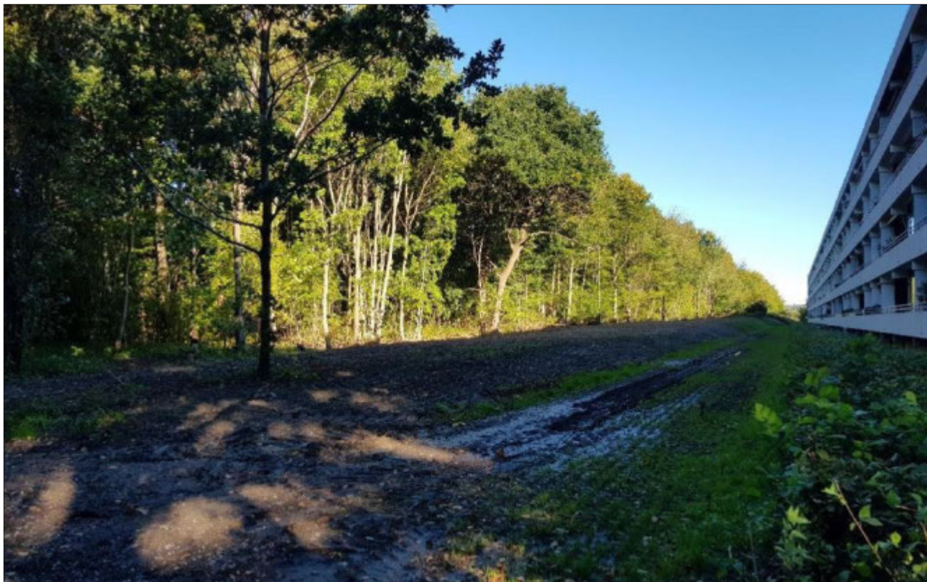
Den etablerede jordvold fremstår med bløde former.

På grund af fredningerne i området krævede planen en dispensation, og den nægtede kommunen i første omgang at give. Skovplanen er en del af fredningen, som er skrevet ind i lokalplanen for området, der inden blokkene blev opført fra 1969 var et fredet skovområde kendt som Tyvekrogen.