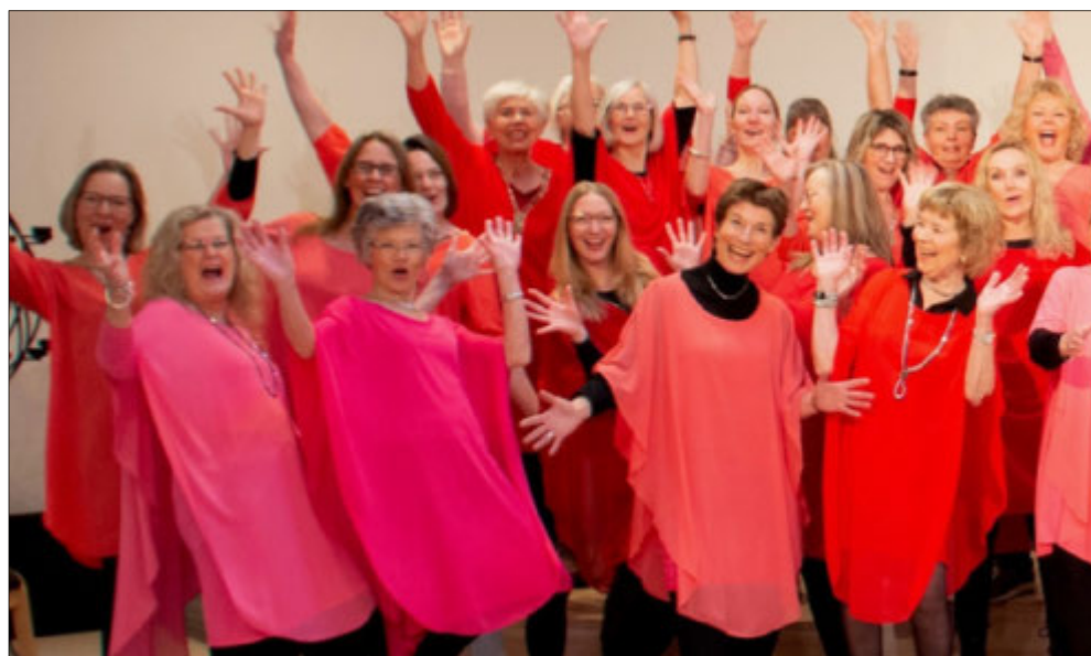
Nordsjællands Gospelkor, også kendt som Krammenkoret, vil stå for aftenens musikalske indslag.